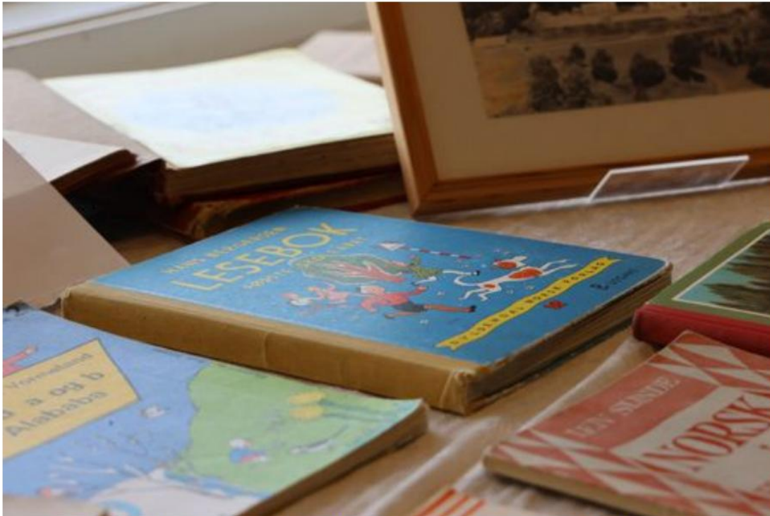
■ ■ ■ Da Kleppe skole feiret 150 årsdag tidligere i år var det mange gamle lærebøker på utstilling. De blir det stadig færre av.