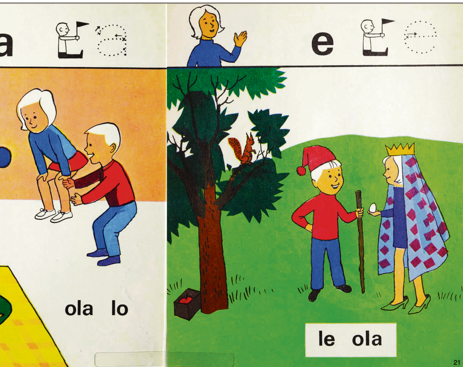
Læreboka Med a og b til Alababa av Sigrun Vormeland vart brukt i norske grunnskular i 1970- og 1980-åra. Elevane skal terpe på bokstavlydar for å knekkje lesekode. Skjermbilete av Sigrun Vormelands Med a og b til Alababa er henta frå Nasjonalbiblioteket

Furuberg legg til at barna sjølv sagt også skal oppleve komplekse og meningsfulle tekstar, men at det kan skje via høgtlesing.