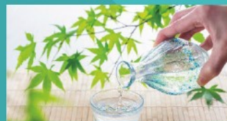
Foto: Nann Nannan (fødsel), Nann Nannan (fødsel) Nann Nannan (fødsel) Nann Nannan (fødsel)