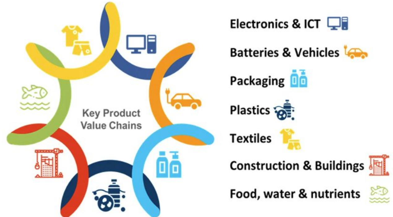
Figure 1: The 7 key product value chains as a matter of priority (priority product groups) of the 2020 Circular Economy Action Plan

Verdikjeder med høy klima- og miljøbelastning og/eller høy potensiale for sirkularitet