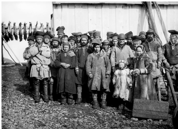
Sjøsamer på Latnjárga/Latnæringen, indre Varanger 1883.

De (samene) utmerker seg ved flid, innretter seg mere økonomisk enn noen nordmann og produserer forholdsmessig større kvanta tørrfisk og tran enn de norske. Mange av dem handler rede for rede og forlanger ikke kreditt 27 .»