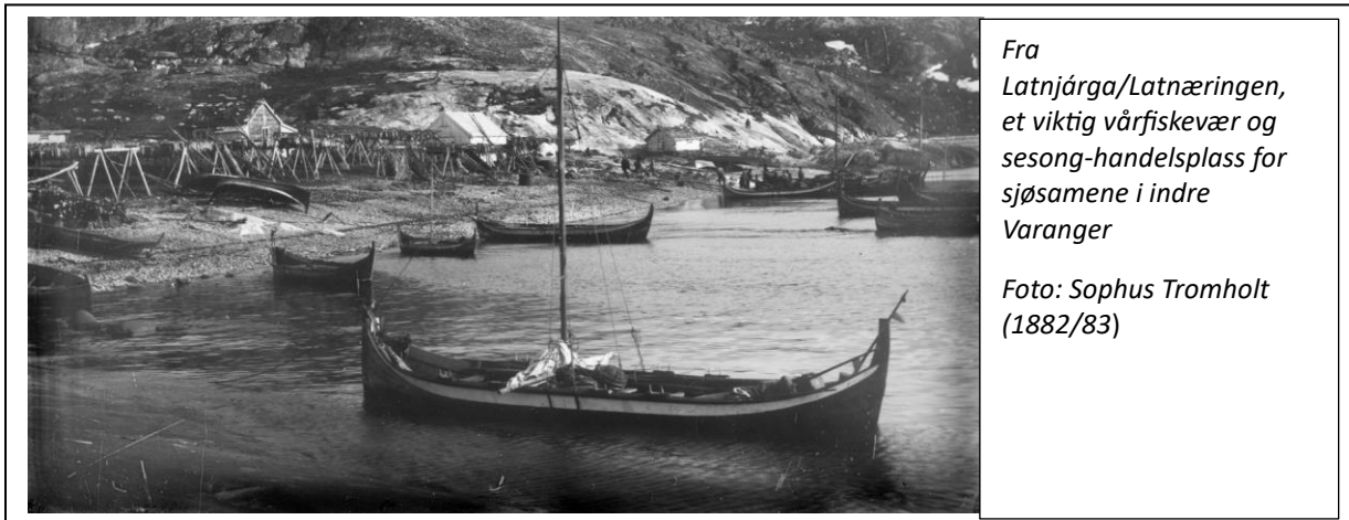
Fra Latnjárga/Latnæringen, et viktig vårfiskevær og sesong-handelsplass for sjøsamene i indre Varanger

Kilder fra slutten av 1100-tallet tyder på at både samiske fiskere og tilreisende norske fiskere deltok i vintertorskfisket i Finnmark på denne tiden 7 . Da de norske fiskeværene ble etablert på 1200-tallet dro samene også ut i værene i sesongen for å delta i det kommersielle fisket.