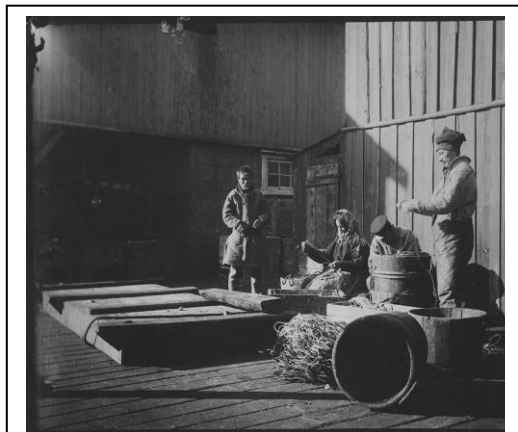
«Fiskeværet Kiberg i Vardø herred er et større fiskevær på nordsiden av Varangerfjorden, øst for Vadsø. Paa billedet ses norske lapper («samer» som de kalder sig nu) som holder paa at sætte agn paa sine liner. Disse ordner de derpaa omhyggelig i linestampene. Agnet er enten lodde eller sil».