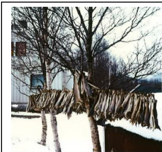
Boknafisk under tørking i Lille Lerresfjord i 1990