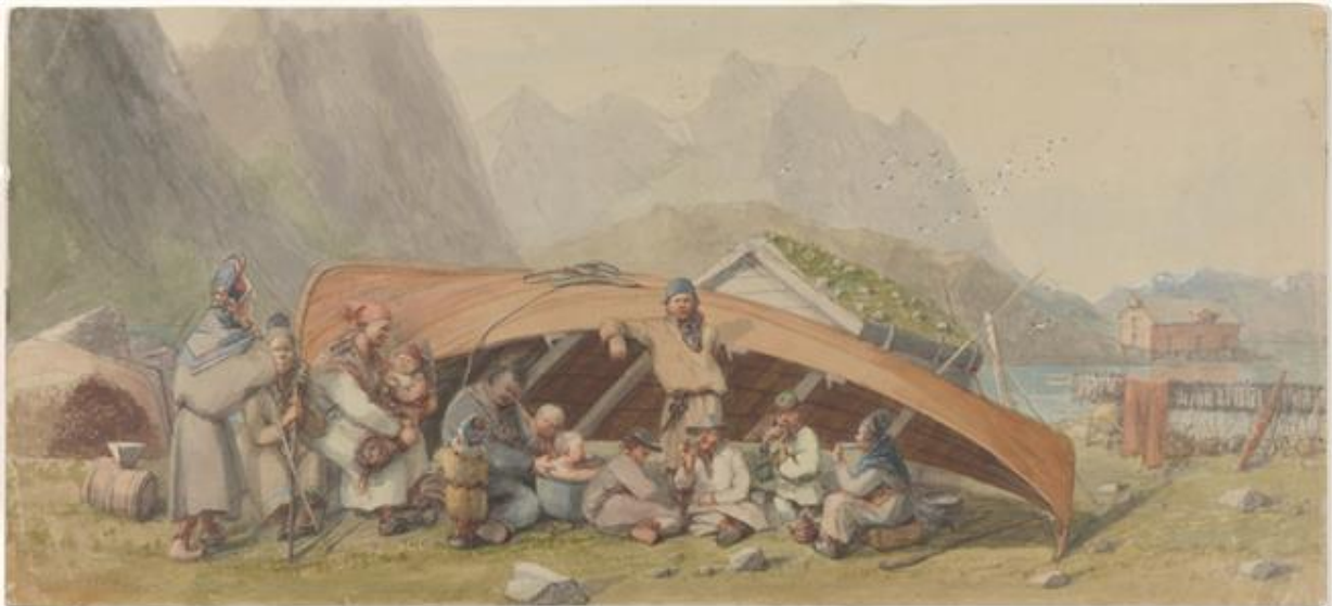
Sjøsamefamilie 1871. Tegning av Hans Johan Fredrik Berg. Tørrfiskhjellen til høyre

Da tørrfiskhandelen knyttet sjøsamene til det europeiske markedet, hadde de allerede i lang tid vært leverandører av skinn og pelsverk til Europa. Tørrfiskhandelen ble på 1200-tallet grunnlaget for etablering av norske fiskevær på Finnmarkskysten, i et område som både Norge, Sverige og Russland gjorde krav på. Fiskeværene ble knyttet til tørrfiskhovedstaden Bergen, men på grunn av Finnmarks plass på verdenskartet, med uklare landegrenser og svak tilstedeværelse av statsmakten, kunne samene også handle med svenske, engelske og nederlandske kjøpmenn i det 16. århundre. Samene var bosatt i fjordene og var språklig, kulturelt og religiøst adskilt fra de norske bosettingene. Prisfall på tørrfisk ved inngangen til det 17. århundre førte til økonomisk kollaps i de norske fiskeværene, men de sjøsamiske bosettingene hadde mer fleksibel og variert økonomi og ble derfor mindre berørt.