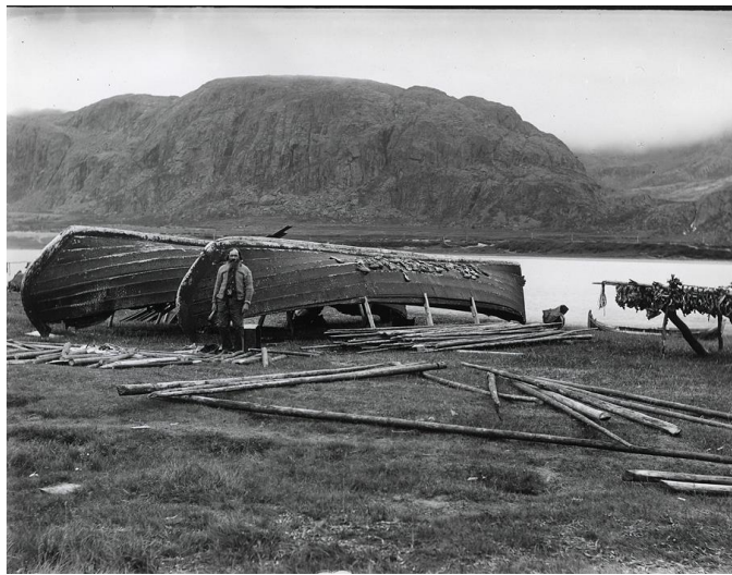
Diminoff, en russisk same, med to russiske fiskebåter i Grense Jakobselv. Tørrfisken til høyre på bildet er trolig beregnet for egen husholdning og dyrefor. Foto: Ellisif Wessel (ca 1900)

Pomorhandelen ble lovlig ved opphevelsen av Bergensmonopolet 1796, russerne kunne da fritt kjøpe