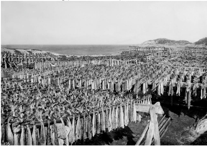
Tørrfisk på Latnjárga/Latnæringen 1883.

Tyveri av tørrfisk fra hjell var på 1600-tallet en alvorlig forbrytelse som ble hardt straffet: I 1614 stjal Sivert i Sværholt en eller to fisk fra en hjell, straffen var en bot på 5 daler, som tilsvarte verdien av 5 våger (190 kg) tørrfisk. Drengen Nils Smeld fra Vardø tok 3,5 kg tørrfisk fra sin husbonds hjell, boten var 3 daler, tilsvarende en årslønn for en dreng (Nedkvitne 1988).