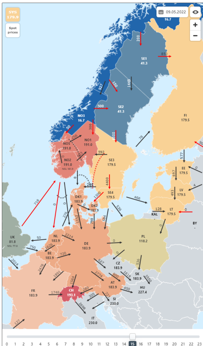
Figur henta frå SYSPower

Det er vanleg å rekne at kraftprisen her i landet heng sterkt saman med hydrobalansen (nedbør + magasinfylling). At Norge er elektrisk knytt saman med resten av Europa, gjer at verdien på kraft her i landet også blir påverka av kva som skjer utanfor våre grenser. Det kan føre til høg eller lågare kraftpris for landet sett under eitt.