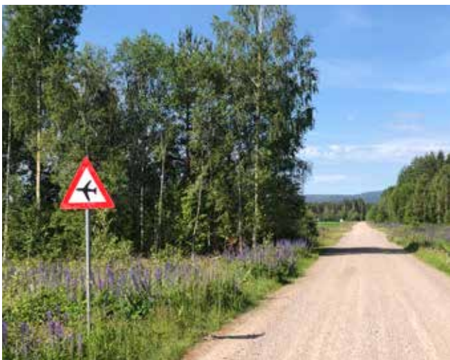
På vei til flyplass