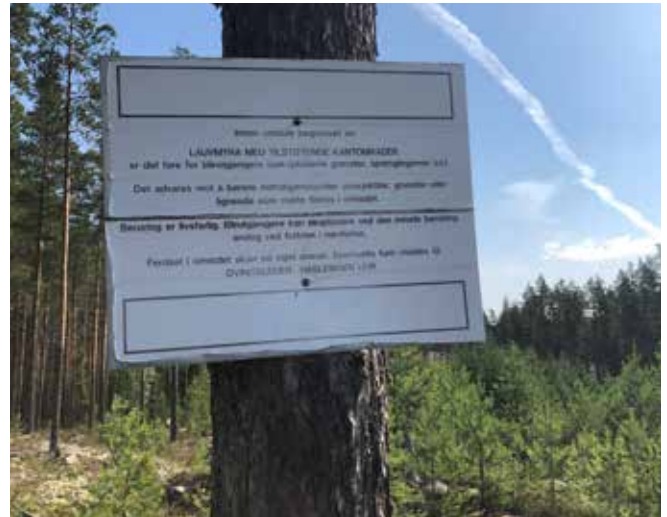
Forsvarets skilt i tilknytning til nedslagsfelt Lauvmyra