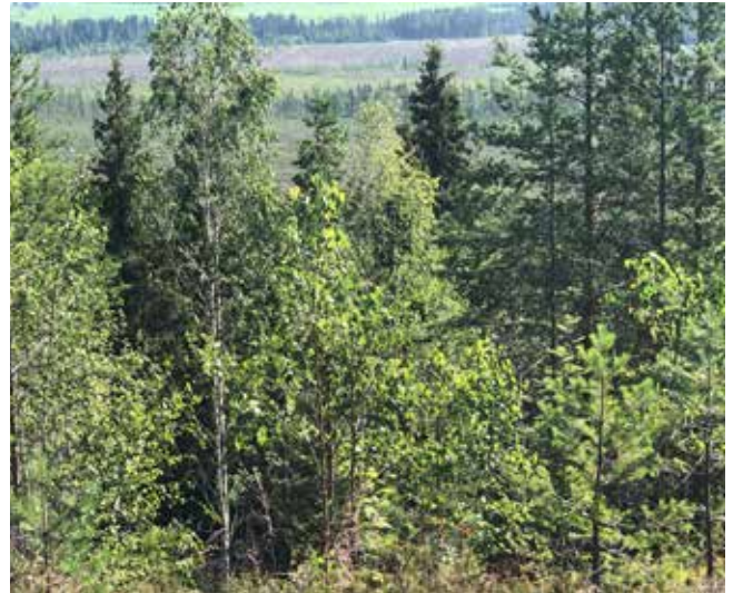
Fra Spulsåstoppen mot leiren, byggene på Storskjæret er synlige.