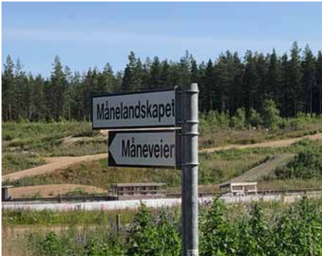
Løyper i månelandskapet