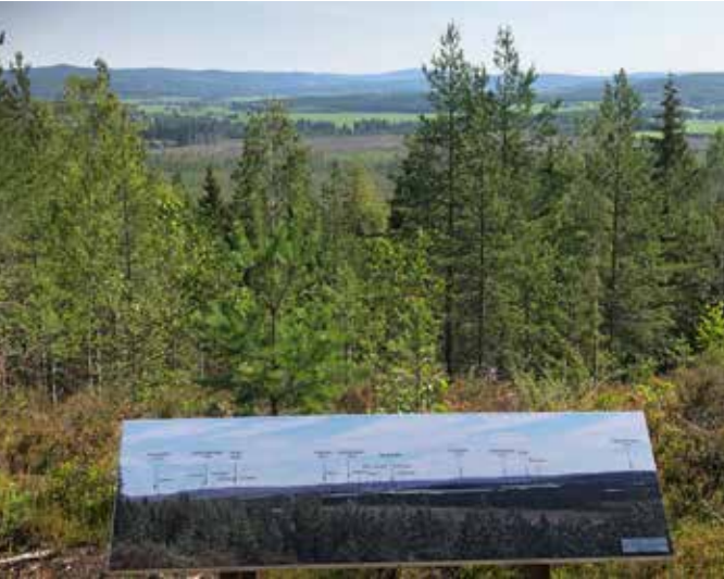
Fra Spulsåstoppen mot Lauvmyra