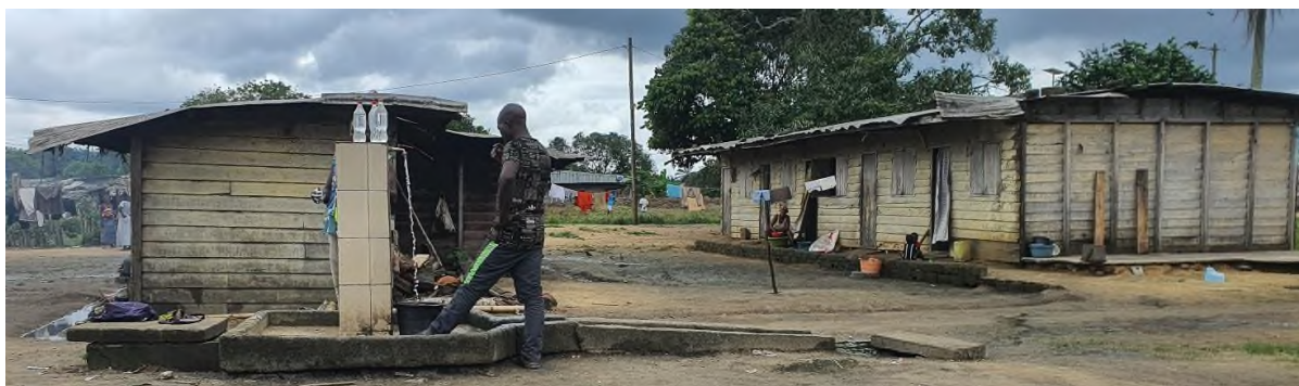
Figur 2 Bilde av boliger i Socapalms boligområder tatt i oktober 2023 33

I 2021 var rundt 20 prosent av husene blitt oppgradert eller erstattet med nye. 32 Hvis Socapalm fortsetter i samme tempo, vil rundt 45 prosent av arbeiderne fortsatt bo i boliger som de som er avbildet nedenfor i 2060, når konsesjonsavtalen går ut.