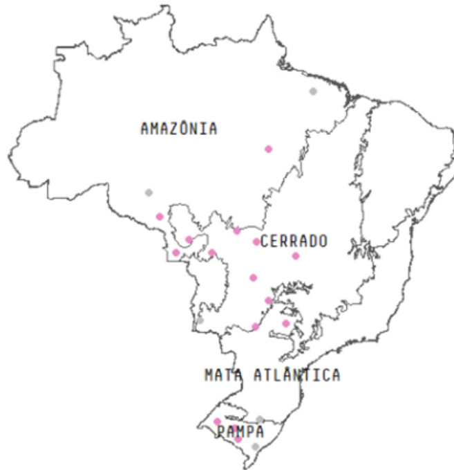
Figur 2: Marfrigs slaktehus som er inkludert i undersøkelsen. For slaktehusene som er markert med rosa, er mer enn 1000 registrerte innkjøp (basert på GTA-data) mellom 2016-2019 analysert. Slaktehus markert med grått blir inspisert av føderale myndigheter, men for disse var ikke innkjøpsdata tilgjengelig.

Tillatelser for kvegtransport, Guia de Trânsito Animal (GTA) , gir detaljer for transport av kvegpartier mellom gårdsbruk og fra gårdsbruk til slaktehus. Tillatelsen inneholder dato for hver transport, gårdsbruket som sender og mottar kveg, antall dyr, deres alder og kjønn. I undersøkelsen er GTA-dataene brukt for å identifisere nettverket av eiendommer og kvegtransportene til de enkelte slaktehusene. 36 Dette nettverket inkluderer indirekte leverandører.