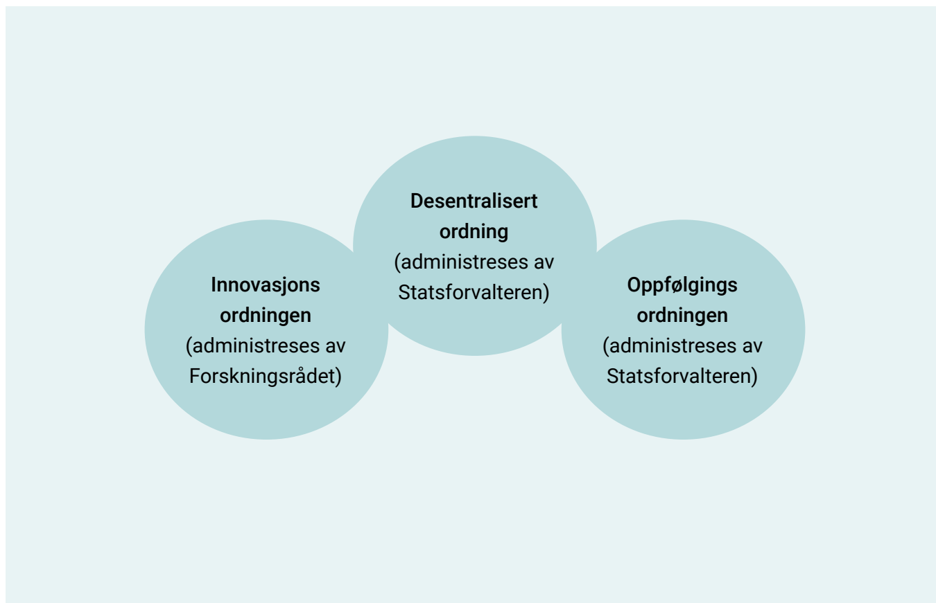
Figur 1: Modell for lokal kompetanseutvikling i skolen, innført i 2017

Målet er at skoler, kommuner og fylkeskommuner i samarbeid med lokale universiteter og høyskoler skal ta ansvar for og bruke sitt handlingsrom til å drive kvalitetsutvikling (Meld. St. 21 (2016–2017)). Kompetansemodellen, slik den presenteres i stortingsmeldingens kapittel 8, består av tre ordninger som visualiseres i følgende figur og beskrives nærmere under: