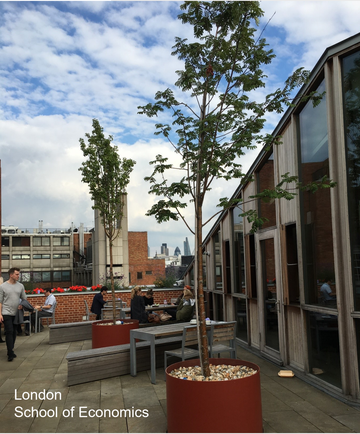
London School of Economics